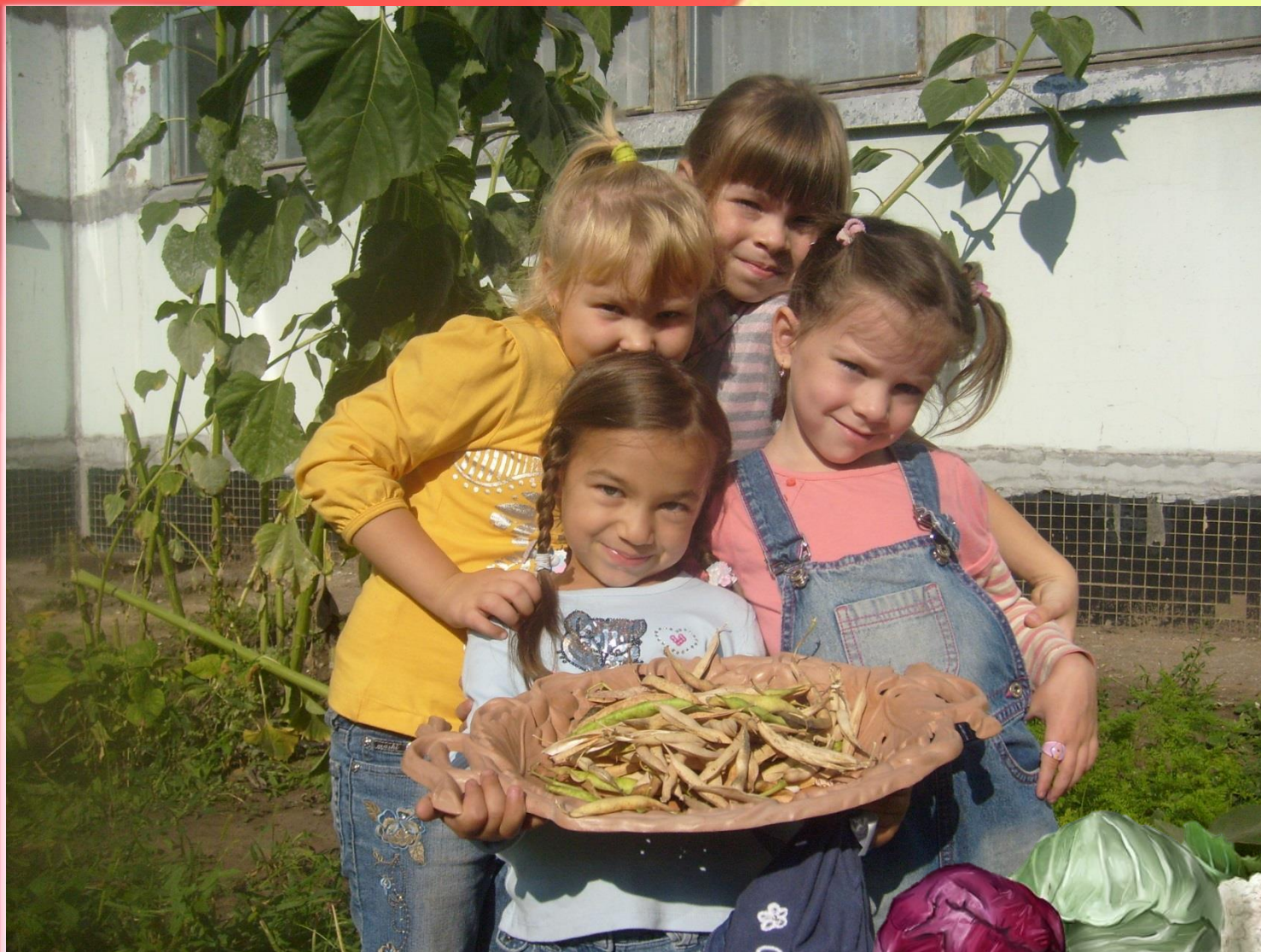
Сбор стручковой фасоли