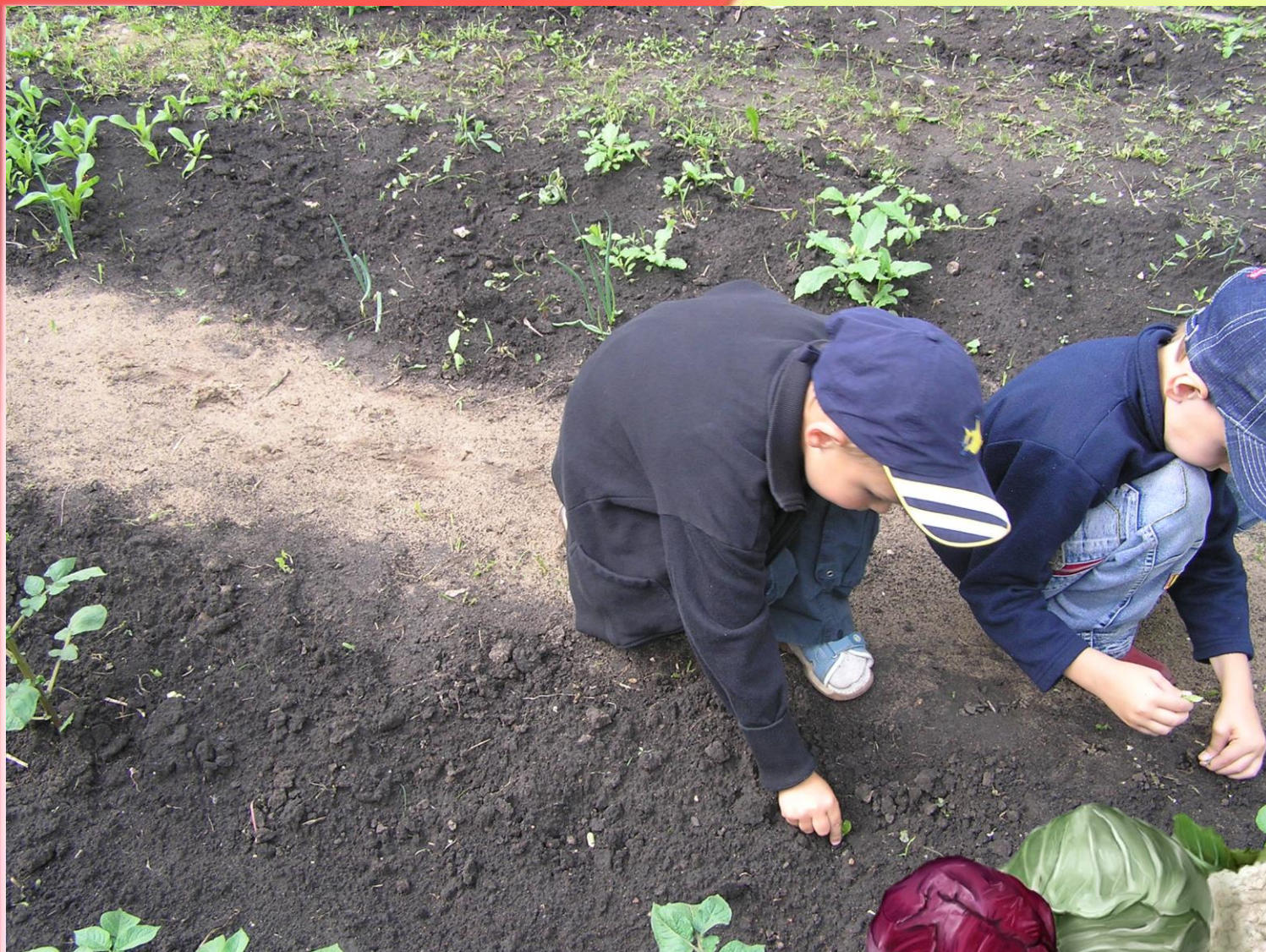
Посадка фасоли и картофеля