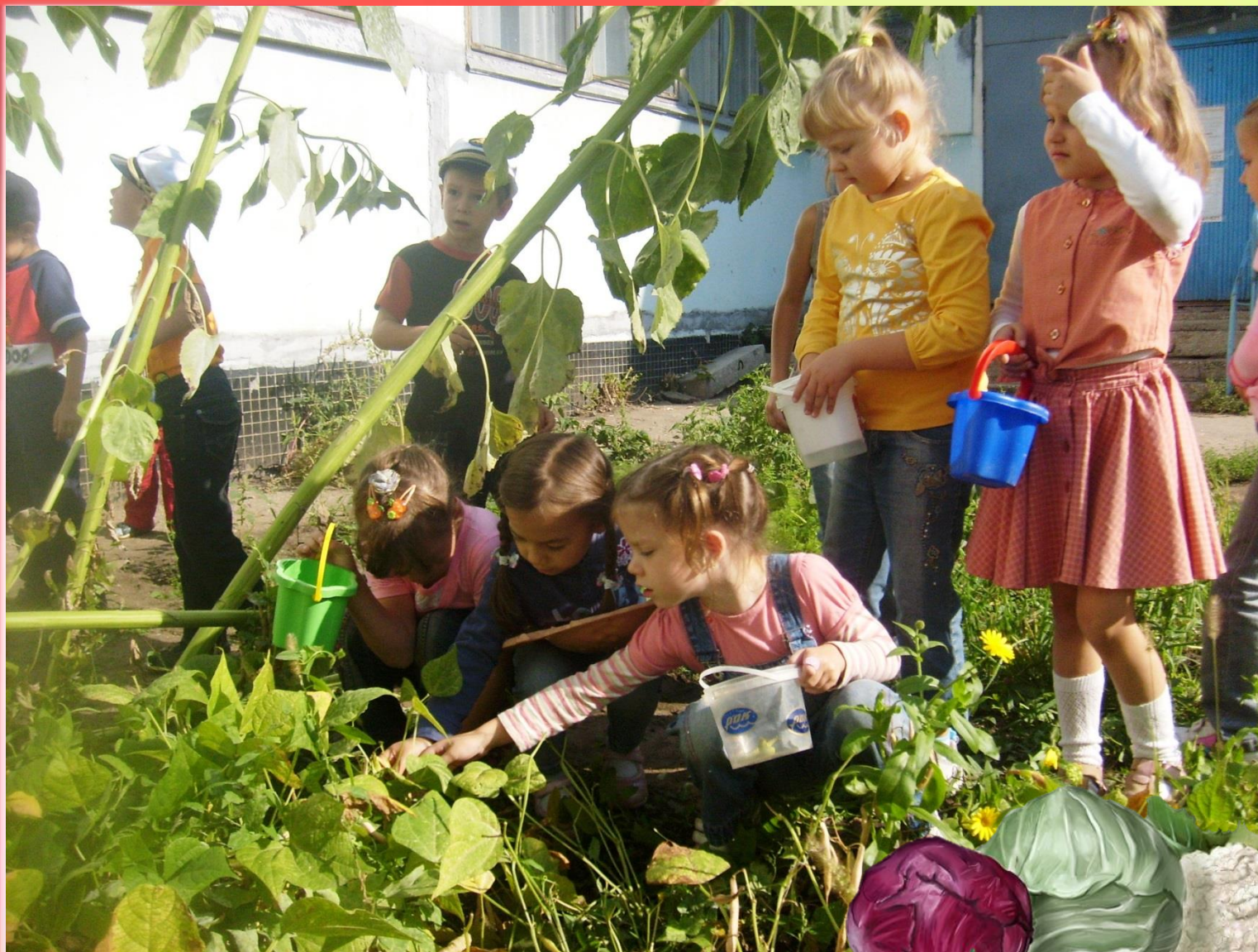
Сбор стручковой фасоли