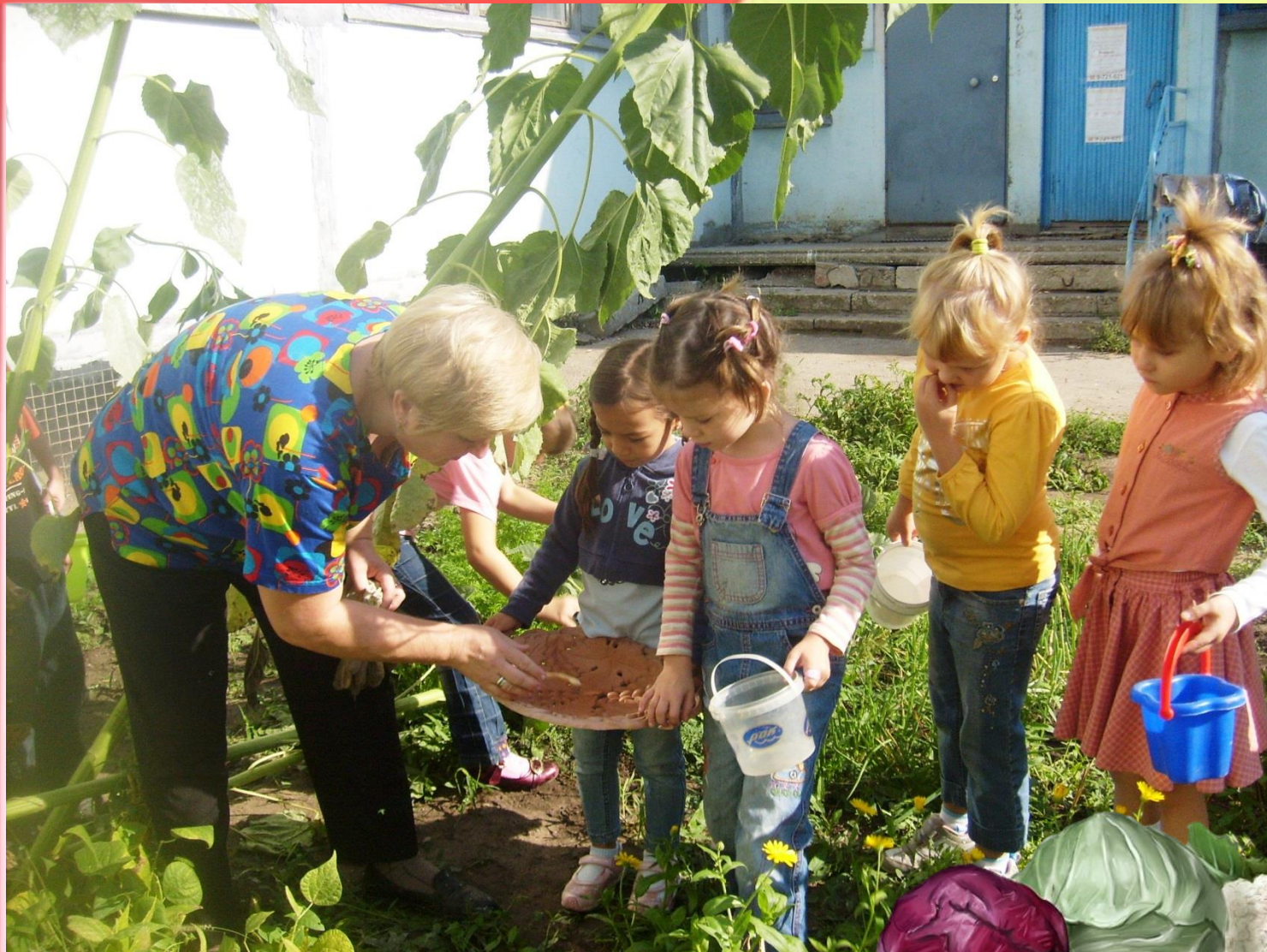
Сбор стручковой фасоли